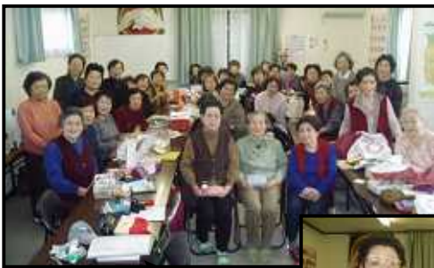
笑顔が溢れる 「とまと」です

いつもは手弁当ですが、12 月5日は年末の昼食会でした。 そしてこの日、米寿(88歳) を迎えた3名の皆さんに、た んぽぽより記念品をお渡しし ました。これからもお元気で 「とまと」へ来てくださいね。