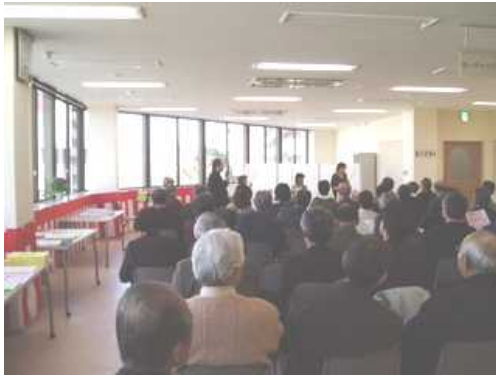
明るい室内でのコンサート

午後は栄区音楽協会による弦楽四重奏とフルート四重奏のミニコンサートからスタートした「さかえ区民活動センター」のオープニングイベントが行われ、多くの区民が参加しました。