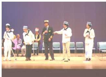
艦長・水兵 カッコいいね 最初の出演でちょっと緊張