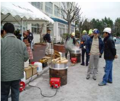
小学校での炊き出しで 400人分のトン汁を

金沢区災害ボランティアネットワークが行った訓練は、地域防災拠点と連携したもので、立ち上げた災害ボランティアセンターでのコーディネートと送り出し、避難所など現地での実践活動と、それぞれ役割分担しながらスムーズに行き、反省会もきちんと実施された良い体験になりました。