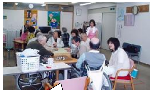
奥の方で百人一首をやっています