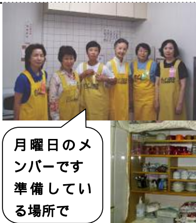
月曜日のメンバーです 準備している場所です

ほぼ毎週の月曜日、そして第1・第3の水曜日はたんぽぽ喫茶の日です。準備ができると、館内放送で呼びかけをします。すると、待っていた入苑者やデイサービスの方たちが、職員に伴われ来店、お好みでコーヒーや紅茶、日本茶の注文をいただき、お菓子を添えてお出しします。会話も楽しみながら、ある時はたんぽぽ会員のピアノ演奏があり、一緒に歌って下さることもあります。また、入所の方が演奏されることも。会員のチームワークも抜群です。